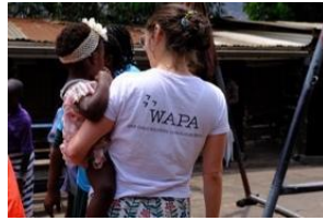
WAPA (War Affected People's Association)