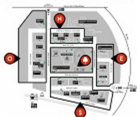
Plan du campus - Université Paris Nanterre